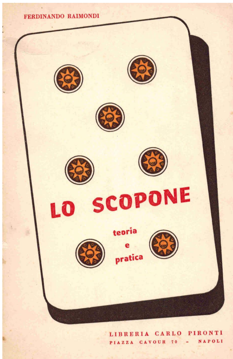
Figura 3 – Copertina dell'edizione napoletana del 1961.

Una particolarità dello scopone ci permette di chiudere qui la nostra rassegna. Diversamente da quanto è avvenuto con altri giochi di carte, la cui moda ha traversato rapidamente molte frontiere, lo scopone è rimasto un gioco italiano: (22) l'unica frontiera che ha attraversato è quella con il Canton Ticino! Ci è quindi risparmiato l'ulteriore compito di cercare eventuali manuali di scopone stampati in lingue straniere.