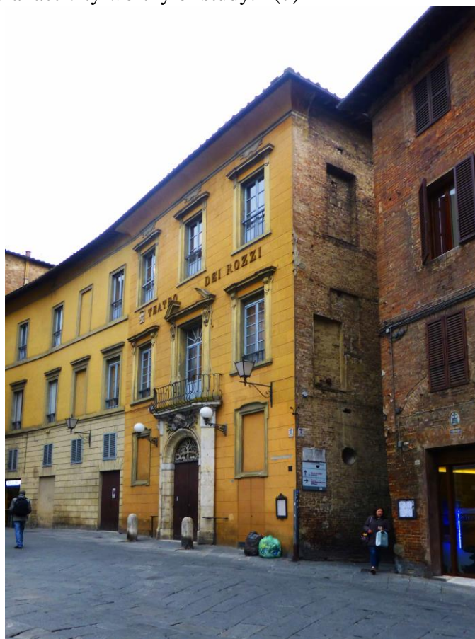
Figura 2 – Siena. Il Teatro dei Rozzi in Piazza Indipendenza.

Su questo atteggiamento dei ricercatori è difficile non condividere il giudizio del più noto esperto sui giochi di carte a livello mondiale: «People who are not card players, even if they are writers on local culture and history, may well consider gambling with cards as a vice, or at best a waste of time, rather than a cultural activity worthy of study.» (7)