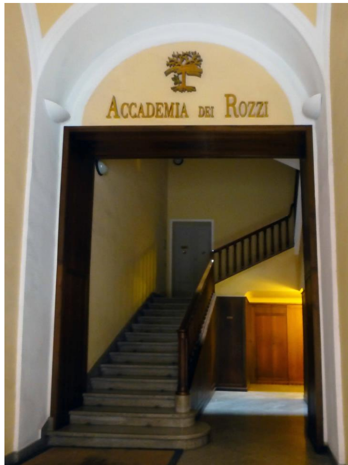
Figura 1 – Siena. Accademia dei Rozzi. Ingresso.

Oltre alle cifre incassate, che rappresentano il dato indispensabile per queste registrazioni, spesso troviamo indicati anche i giochi corrispondenti. Per questa via è possibile ricostruire, per l'epoca documentata, la popolarità dei giochi di carte in quello specifico ambiente, in una maniera quantitativa che raramente è stata utilizzata negli studi sui giochi.