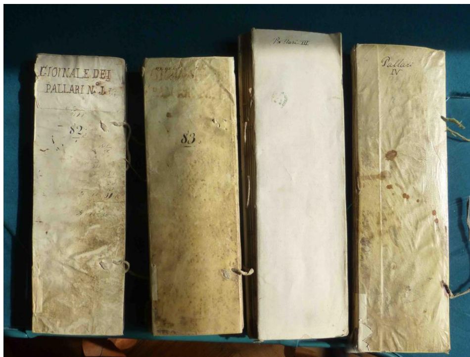
Figura 3 – Siena. Circolo degli Uniti. Archivio. Le quattro vacchette dei pallari.

L'indicazione sulle copertine dei numeri romani da I a IV, che sembrerebbe dell'epoca, lascerebbe propendere per l'ipotesi che invece non si ebbero per questi registri particolari danni dalla guerra, ma eventualmente da perdite o lacune precedenti.