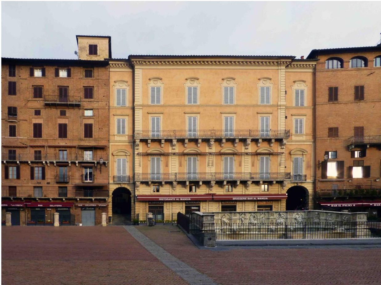
Figura 1 – Il Circolo degli Uniti, visto da Piazza del Campo.

Il Casino dei Nobili di Siena, poi Circolo degli Uniti, è stato descritto in molte pubblicazioni, senz'altro più di tutti gli altri della Toscana, compreso quello di Firenze. La cosa non può sorprendere se solo si prende in considerazione la sua sede prestigiosa nell'antico Palazzo della Mercanzia che si affaccia direttamente sulla Piazza del Campo, come mostrato nella Fig. 1. (Anche questa Piazza sempre affollata può presentarsi vuota, al sorgere del sole.)