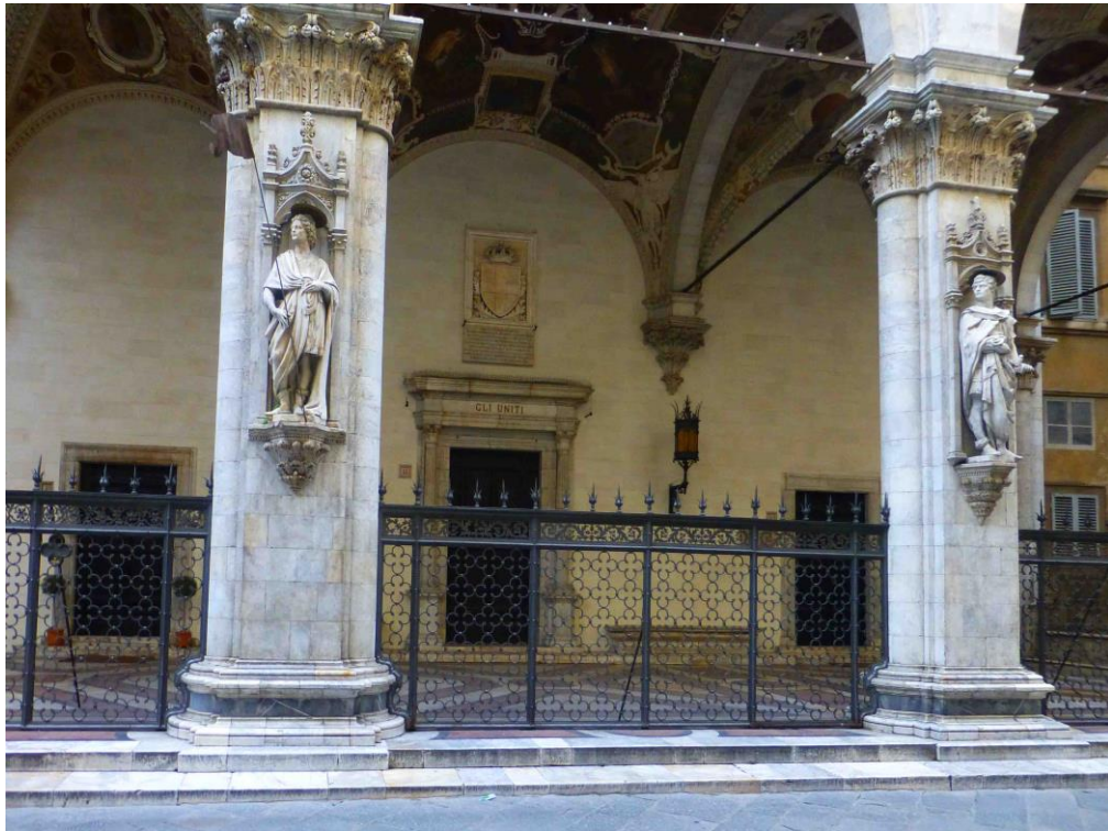
Figura 2 – Siena. La Loggia della Mercanzia. Particolare.

Esisteva uno stretto collegamento fra i nobili del Casino e le contrade cittadine, che si rifletteva nella frequenza e facilità con cui gli Uniti erano in grado di mobilitare l'intera cittadinanza per palii straordinari, tornei, o altre manifestazioni in cui molti cittadini assistevano ai festeggiamenti e contribuivano alla loro riuscita.