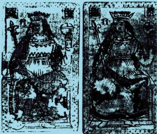
Fig. 2. Deux atouts n° II.

entières bien conservées à des fragments très endommagés, représentant moins du quart d'une carte. Toutes semblent avoir eu les mêmes dimensions – 96 x 54 mm –, le même type, les mêmes dos rabattus sur le devant. Dans chaque cas, le cartier signe Al Sole , cette indication étant imprimée sur le dos ; la typographie de ces inscriptions est inhabituelle, car elle évoque celle des machines à écrire modernes. Il y a pourtant au moins sept jeux représentés :