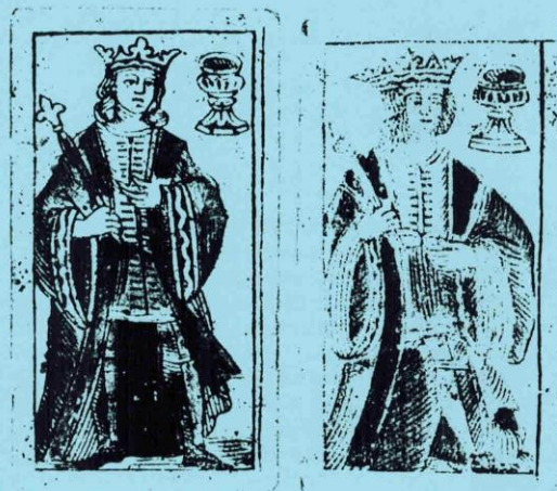
Fig. 4 (a et b). Deux rois différents avec dos identiques.

Dans une communication précédente (9) , j'avais insisté sur la similarité des noms de cartiers à 8 lettres figurant sur les dos des cartes florentines. Un tel fait, ainsi que les échanges entre cartiers, a déjà été souligné par Miss Mann pour l'ensemble du domaine italien (4) . Plus nous notons de détails sur les cartes florentines, plus sa théorie selon laquelle «plusieurs cartiers achetaient des feuilles non coupées [à d'autres] puis publiaient le produit fini sous leur propre nom» se vérifie. D'autre part, cette observation est confirmée par les documents sur les cartiers : à Milan, Paolino da Castelletto signait, déjà en 1508, un contrat par lequel il s'engageait – contre le paiement de 16 livres en deux versements – à louer à Gaspare da Besana autant de bois gravés pour imprimer des cartes à jouer que Gaspare le souhaitait (9) .