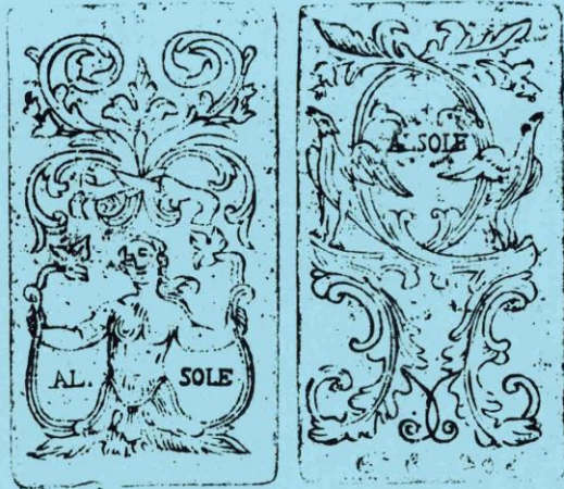
Fig. 3. Dos «Al Sole».

A part la présence de dos différents – quoique de même facture –, la caractéristique la plus surprenante est que la légende Al Sole sur le dos soit associée à Al Soldato qui figure sur les faces, comme c'est le cas sur la banderole du deux d'épées. On peut imaginer que les cartes faites par Al Soldato (le cartier le plus connu portant ce nom traditionnel est localisé à Bologne au XVIII e siècle) étaient vendues par Al Sole ; soit parce que le second avait succédé au premier, soit parce qu'il avait adapté des cartes bolonaises pour le marché toscan. On connaît un autre cas semblable (7) celui qui réunit All'Aquila et, encore une fois, Al Soldato .