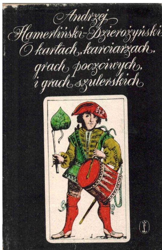
Figura 2 – Copertina del libro più completo.

Il trattato polacco sui giochi di carte più ricco che conosco è quello di Andrzej Hamerliński-Dzierożyński 5 ; per i nostri scopi non riesco a immaginare un'opera più adatta di questa. Per prima cosa, il libro (si veda la Fig. 2) contiene un numero insolitamente alto di pagine, ben 421; ma il vantaggio decisivo su tutti gli altri studi esaminati è che questo libro non è un manuale di giochi di carte provvisto di un'introduzione storica, ma risulta invece dedicato integralmente alla storia dei giochi di carte in Polonia.